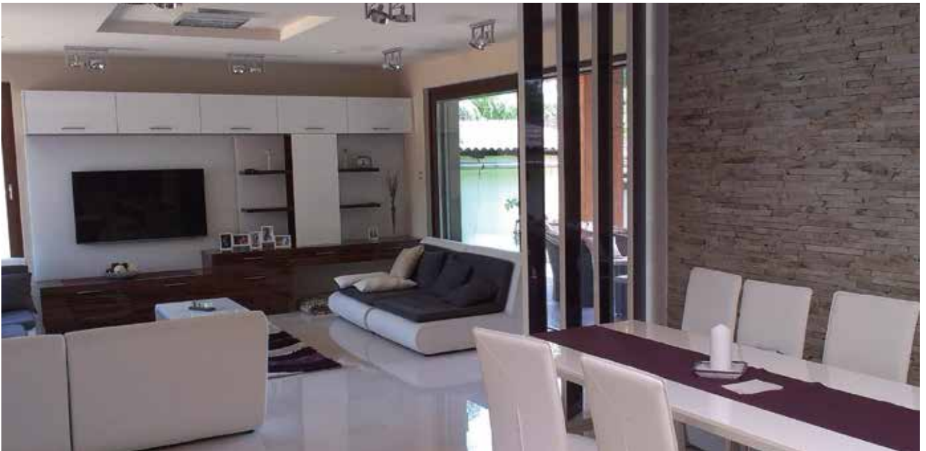
Tatai családi ház fiatalosan

egyedül végigvittem. Szép munka! – ezt mondta, s tudtam, hogy ez tőle hatalmas elismerés.